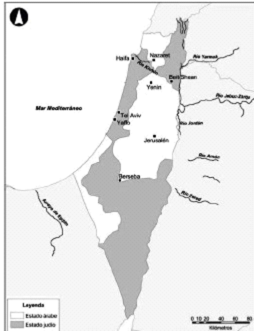
MAPA 2. Plan de Partición de Palestina

El impacto político del voto judío y más aún la presencia pública judía, que mayormente apoyaba al sionismo, contribuyeron a favor del futuro Estado de Israel.